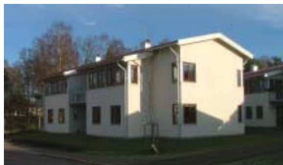
Borgmästaren 3 (2)