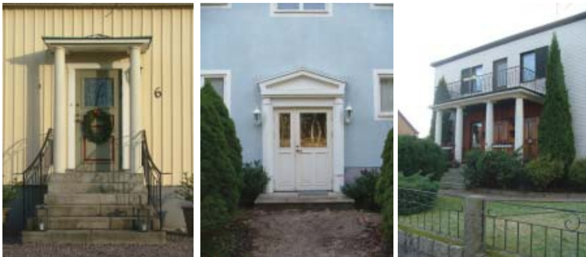
Klassicistiska detaljer på fastigheterna Bleckslagaren 23, Bokbindaren 10 och Bokbindaren 6

Madesjö prästgård, upprättad 1790, kan man följa vägens sträckning över nuvarande Myrdalen.