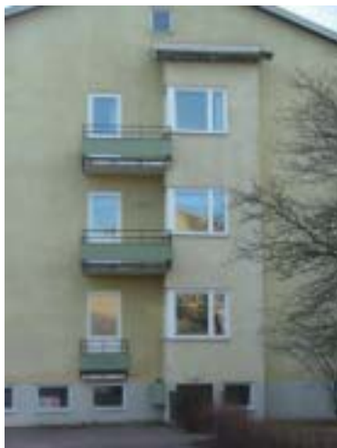
Sättaren 1 (1951)