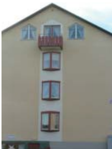
Stabbläggaren 20 (1956)