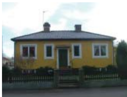
Etsaren 14 (1941)