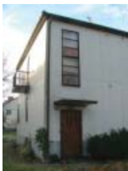
Bokbindaren 2 (1939)