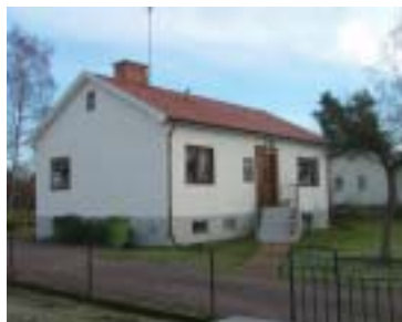
Glasblåsaren 14 (1950)