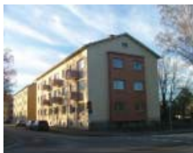
Bokbindaren 1 (1944)