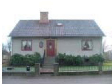
Sliparen 12 (1954)