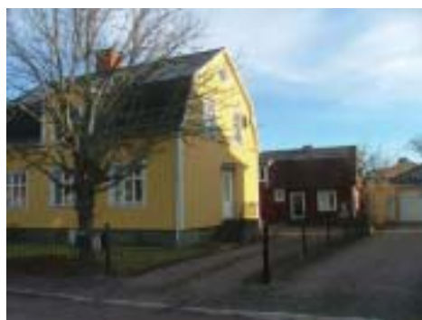
Borgmästaren 6 (1924)

Stadsdelens äldsta hus avslöjar sig i de brutna taken och ibland överlevande uthus.