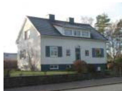
Färgaren 1 (1940-tal)