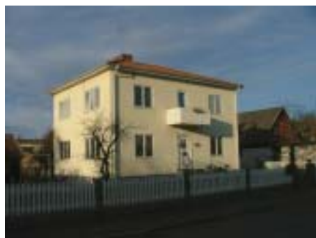
Smedjan 10 (1930-tal)