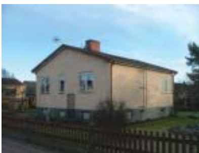
Bleckslagaren 12 (1944)