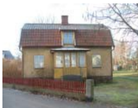
Bleckslagaren 1 (1926)