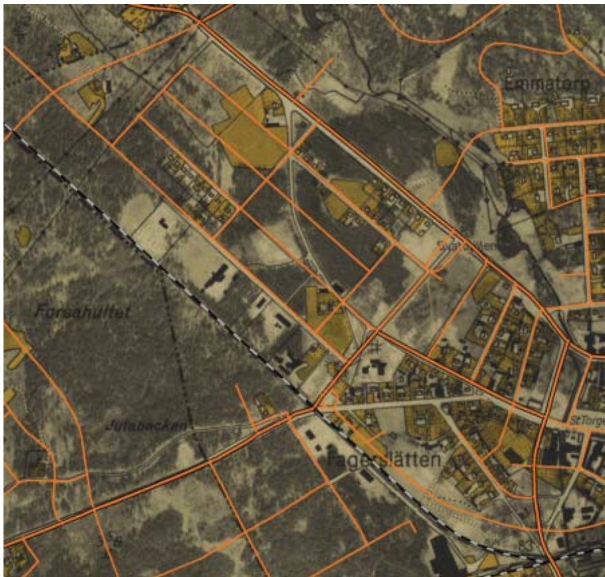
1941 års ekonomiska karta med dagens gatunät inlagt i orange färg.

Av okänd anledning blev inte planen det efterlängta startskott för byggnation som stadens fäder så sett fram emot. Bostadsbristen blev allt värre, liksom den ekonomiska situationen under 1930-talets krisår. Sannolikt hade man som privatperson med måttlig lön och många barn helt enkelt inte råd att bygga eller också vågade man inte skuldsätta sig i de oroliga tiderna. Kommunalfullmäktige ordförande och ledamöter enades om att tillsätta en kommitté med uppdrag att utarbeta förslag till lågprisbostäder för barnrika familjer i Nybro. Man beslöt att staden kostnadsfritt skulle upplåta byggnadstomter inom kvarteren Rapphönan (Östermalm) och Etsaren (Myrdalen) för mindre bemedlade familjer med minst tre barn och med hemortsrätt i Nybro. Kvarteret