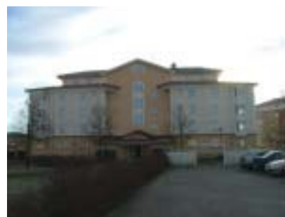
Korgmakaren 2 (1987)