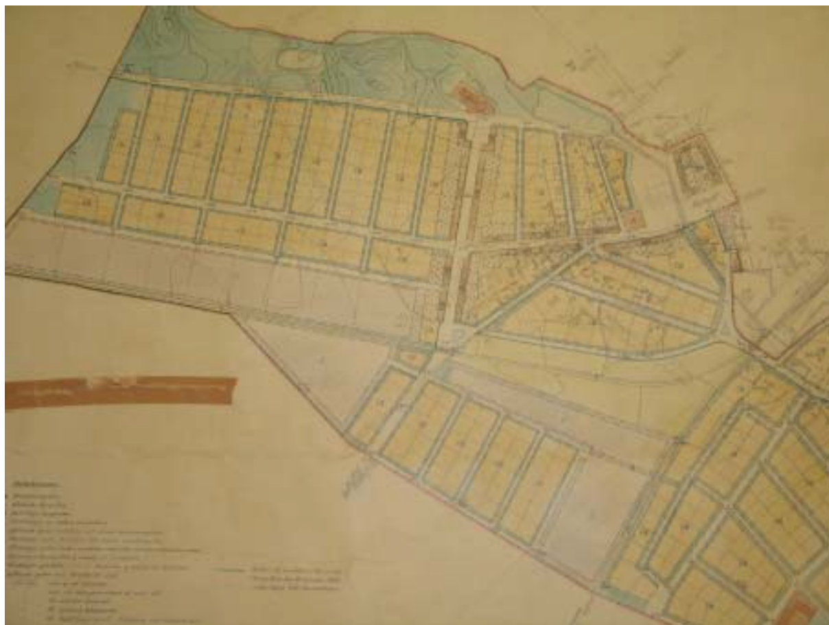
1931 års plan (beskuren).