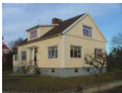
Bleckslagaren 23 (1947)