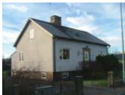
Bleckslagaren 9 (1949)