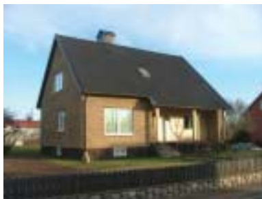
Garvaren 14 (1958)