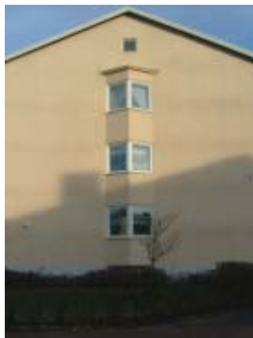
Tryckaren 10 (1949)

Stadsfullmäktige uttalade sig omkring 1940 positivt till uppförande av ett flerfamiljshus i kvarteret Bokbindaren i hörnet Sveavägen/Dr Sandbergs gata. Hörnhuset var färdigt för inflyttning 1944 och övertog som det första av Nybro Kommunala Bostads AB, som bildades samma år. Det dröjde inte länge förrän hela gatan kantades av liknande hyreslängor, helt i enlighet med stadsplanen. De höga flerbostadshusen, uppförda direkt i gränsen till trottoaren, utmed den långa spikraka gatan, bildar ett slutet, nästan komprimerat gaturum, där perspektivet förstärks av det parallella linjespelet: Gata, hus och himmel strålar samman i trafikkarusellen vid Jutarnas väg. De långa slutna fasaderna till trots, är Dr Sandbergs gata ljus och visuellt ”rymlig”.