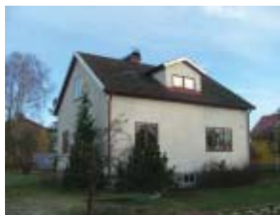
Bleckslagaren 18 (1948)